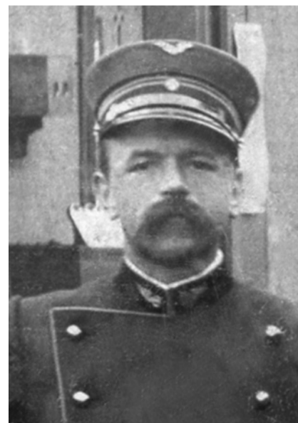
Mathias Buser-Ott

wärtsfahren bei der Weiche 6 jedoch auf dem Stammgleis weiter, der folgende Wagen fuhr mit der zweiten Achse jedoch auf der Weiche in Richtung Abstellgleis. Somit wurde der Wagen auf zwei Gleisen vorgeschoben und schliesslich aus den Gleisen geworfen, sodass er in schräger Richtung zwischen den Gleisen zu stehen kam. Der Bahnverkehr wurde für rund eine Stunde unterbrochen, was eine Verspätung für die zu dieser Zeit kursierenden Schnellzüge 130 und 128